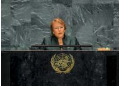
Presidenta Michelle Bachelet en Reunión Plenaria del 64° Período de Sesiones de la Asamblea General de Naciones Unidas.