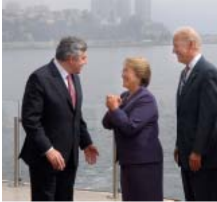
La Presidenta Michelle Bachelet en fotografía oficial de la Cumbre de Líderes Progresistas junto al Primer Ministro del Reino Unido, Gordon Brown y el Vicepresidente de Estados Unidos, Joseph Biden.